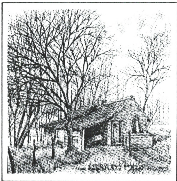
Oude Bakoven aan de 'Oude Spaanse hoeve' - Hoge weg - Battel - Zennegat.

Tentoonstelling van tekeningen en aquarellen in de Schranshoeve van 4 februari tot 27 februari 94.